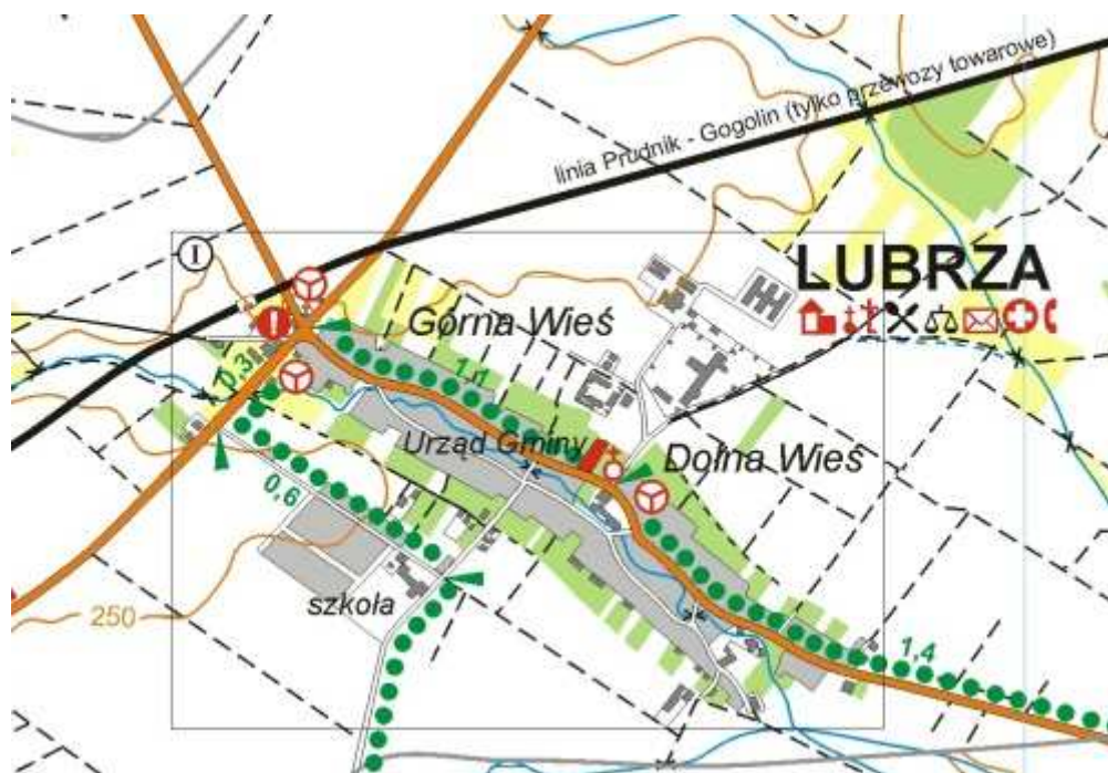
Mapa Sołectwa Lubrza

Sołectwo Lubrza zamieszkuje 979 osób*, głównie zajmujących się pracą na roli oraz usługami. Wieś znajduje się w strefie bezpośredniego oddziaływania miasta Prudnik, które pełni rolę ośrodka regionalnego, skupiającego ponad lokalne urządzenia usługowe i miejsca pracy.