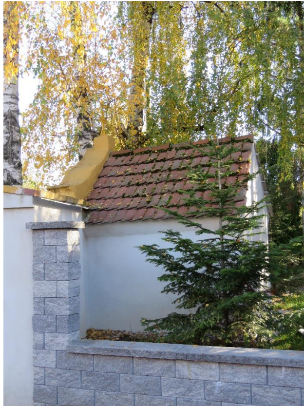
Kapliczka przy ulicy Nowej Naprawy w sąsiedztwie zagrody nr 54