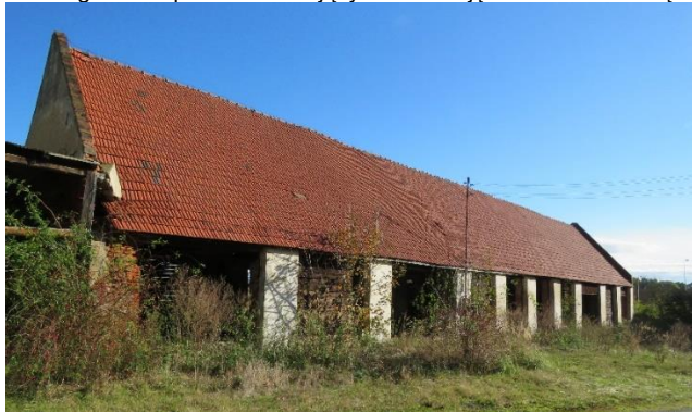
Stodoła od strony północno- wschodniej

8. Fotografia z opisem wskazującym orientację w stosunku do sąsiednich terenów lub stron świata albo mapa z zaznaczonym stanowiskiem archeologicznym