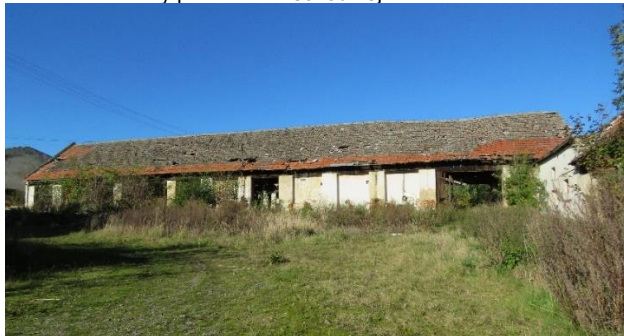
Stodoła od strony północno - zachodniej