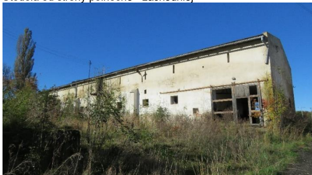
Budynek inwentarski od strony północnej - zachodniej