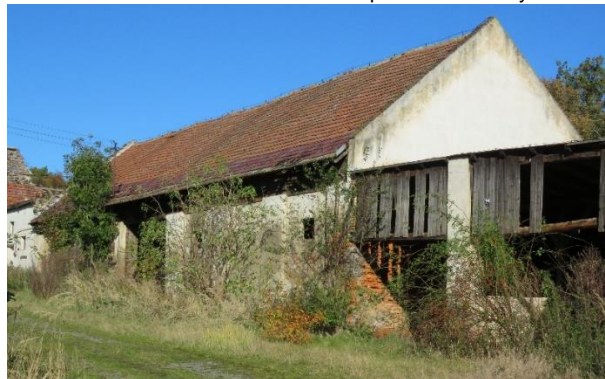
Budynek gospodarczy od strony północno- wschodniej