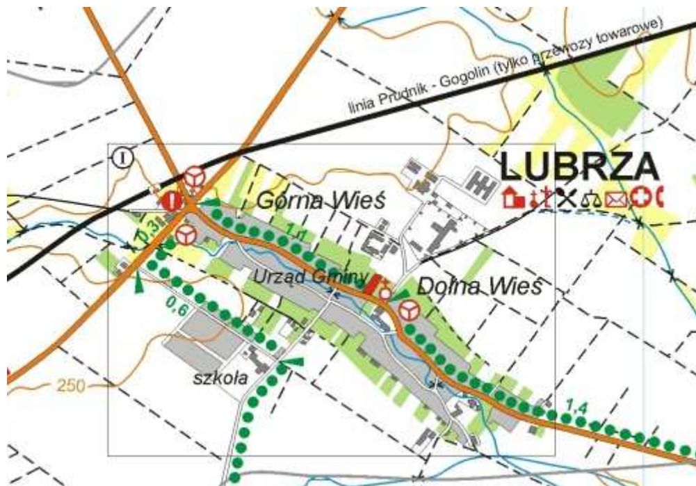
Mapa Sołectwa Lubrza

*wg stanu na dzień 31.12.2014r., dane Gminy Lubrza